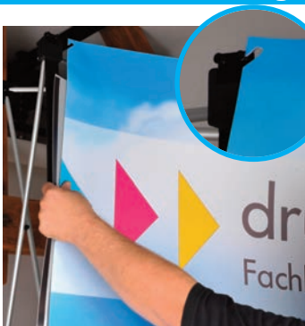
Die erste Druckbahn vorsichtig abrollen. Das obere Ende mit den Einkerbungen in die vorgesehen Haken links und rechts befestigen.