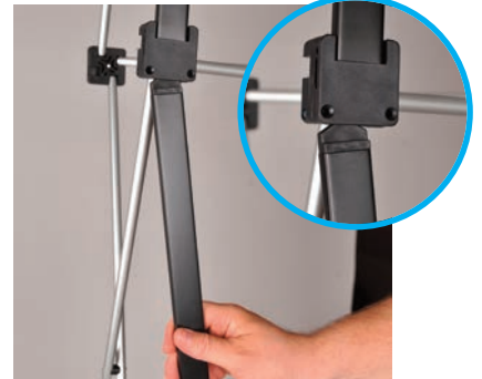
Nun kann die mittlere Schiene unter die obere Schiene in den Schlitz gesteckt werden. Und die Unterste wiederum unter die mittlere Schiene. Somit hat man eine von sechs Metallbahn fertig-gesteckt.