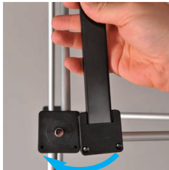
Dann das untere Ende der Schiene von rechts nach links in das nächste Verbin-dungsstück einhaken.