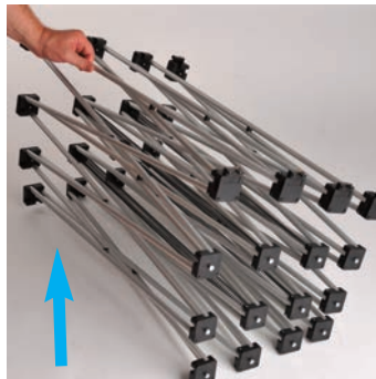
An den Stangen festhalten und vorsichtig nach oben hin auseinander ziehen bis es vollständig aufgezo-gen ist und einen stabilen Stand einnimmt. (ACHTUNG: Einklemm-gefahr!)