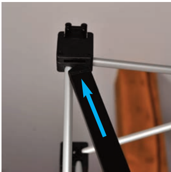
Metallschienen einsetzen. Zuerst die oberste Schiene mit dem spitzen Ende oben in den Schlitz stecken.